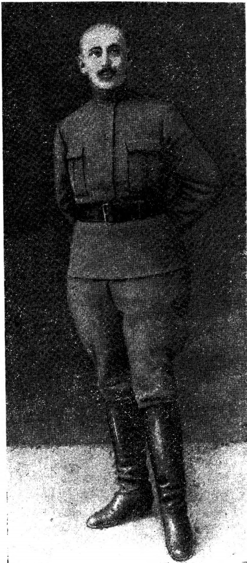
В. К. Блюхер, 1918 год